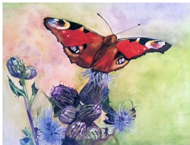
Aquarel 42 x 34