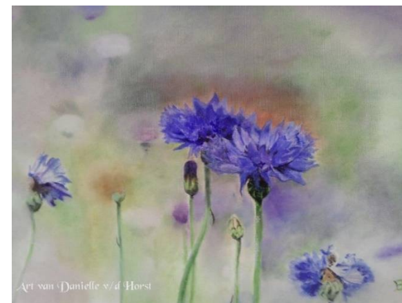
Aquarel 58 x 50 met lijst